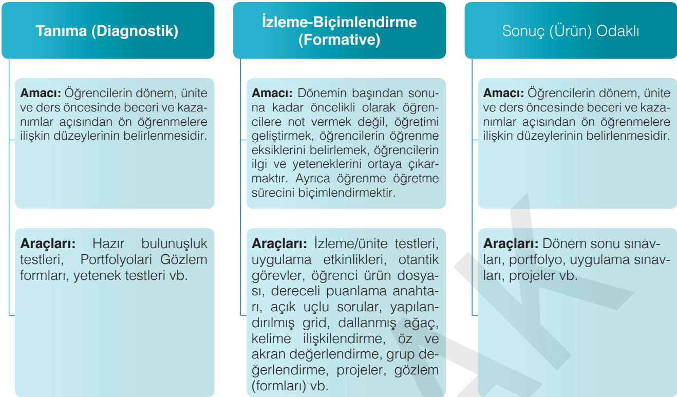
Şekil 1. Ölçme ve Değerlendirme Uygulamaları

Programda 4-5. sınıflarda Fen ve Mühendislik Uygulamaları ile 6-8. sınıflarda Fen ve Mühendislik Uygulamaları ve Girişimcilik ünitelerine yer verilmiştir. Öğrencilerin programdaki kazanımlara ulaşma durumlarının belirlenmesi için Şekil 1'deki ölçme ve değerlendirme türlerinin ve araçlarının yanı sıra, önceki ünitelerde yer alan uygulamalara yönelik süreç ve ürünlerin de bu üniteler kapsamında değerlendirilmesi öngörülmektedir.